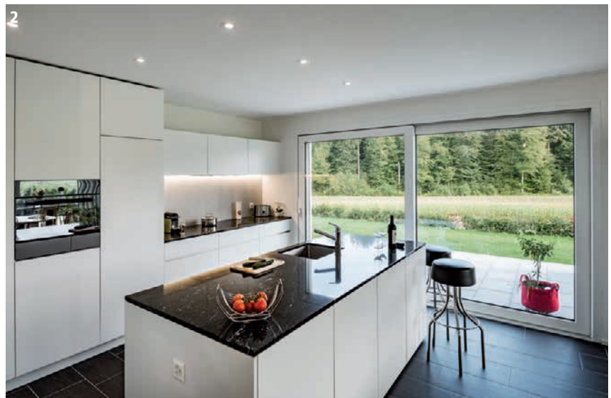
Foto gross) Der strahlend weisse Kubus mitten im Grünen zieht die Blicke an. 1) Wohin soll man den Blick wenden? Zum Cheminée, Fernseher oder lieber zum Aquarium? 2) Im Freien kochen: Hier wird es möglich. 3) Ein klares Weiss, kombiniert mit unterschiedlich strukturierten dunklen Flächen: Das ist gleichermaßen elegant wie zeitlos. 4) Starke Kontraste auch im Bad.