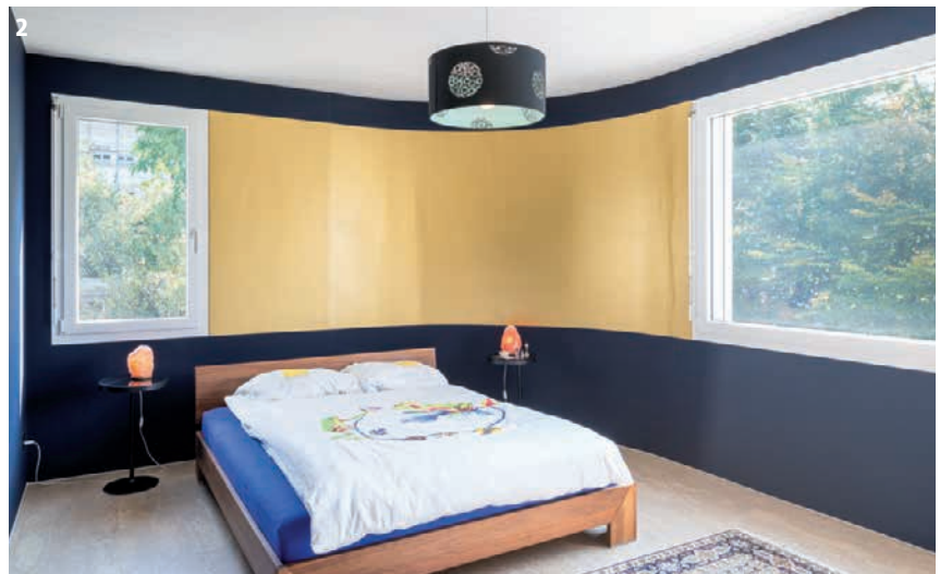
Foto gross) Ein Haus, das auffällt: Die «Round Box» spiegelt die Individualität der Bewohner.