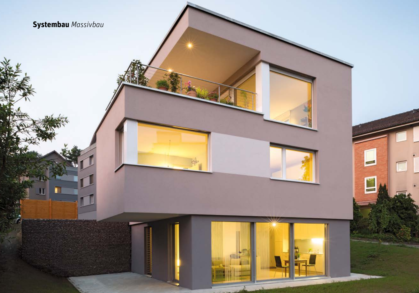
Foto gross oben) Wohnlichkeit pur auf drei Geschossen – mit praktischer Einliegerwohnung im Untergeschoss. Foto gross unten) Hier sieht man die Eingangsbereiche der zwei Wohnungen. 1) Freie Sicht im traumhaften Attikageschoss. 2) Blick auf die Terrasse und die im Raum zurückversetzte Küche.