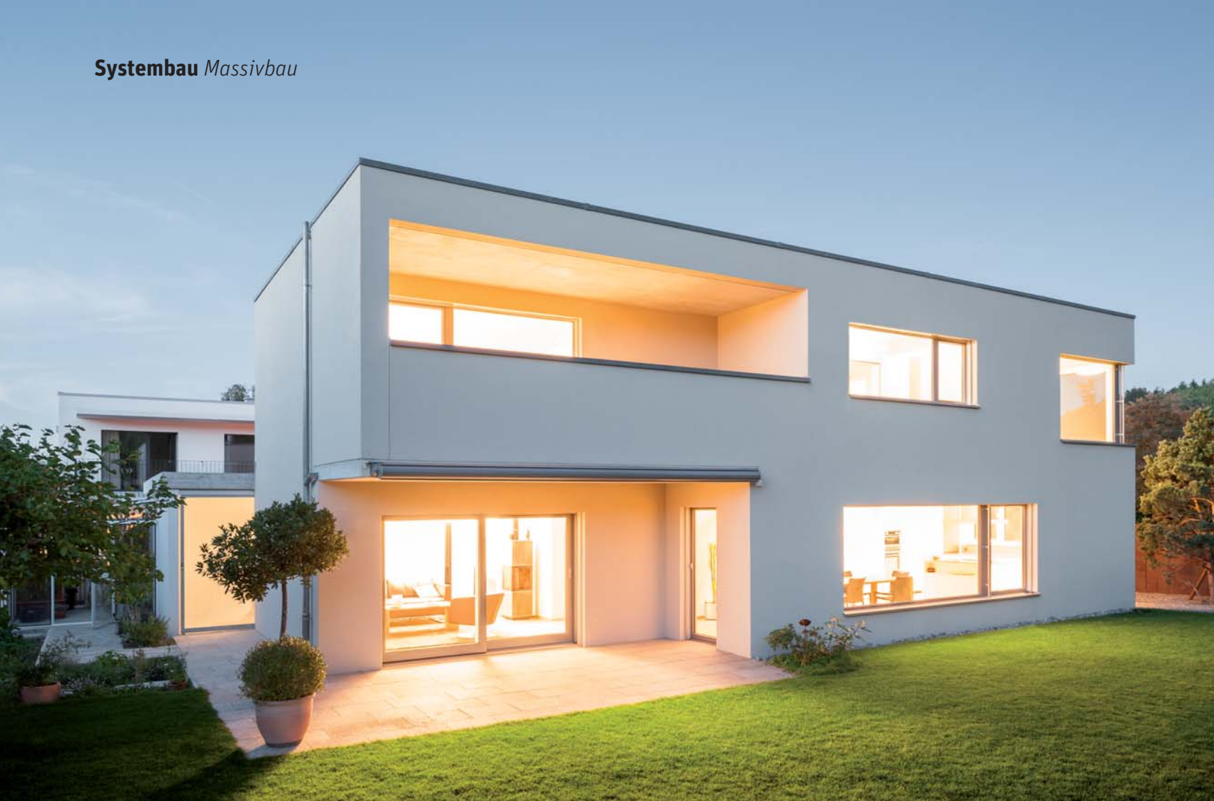
Foto gross oben) Exklusiver Lebensraum – moderne Architektur an bester Lage. Foto gross unten) Das Lieblingsplätzchen für die ganze Familie – Lesecke mit Traumaussicht. 1) Reizvoller Lichteinfall im langen Korridor.