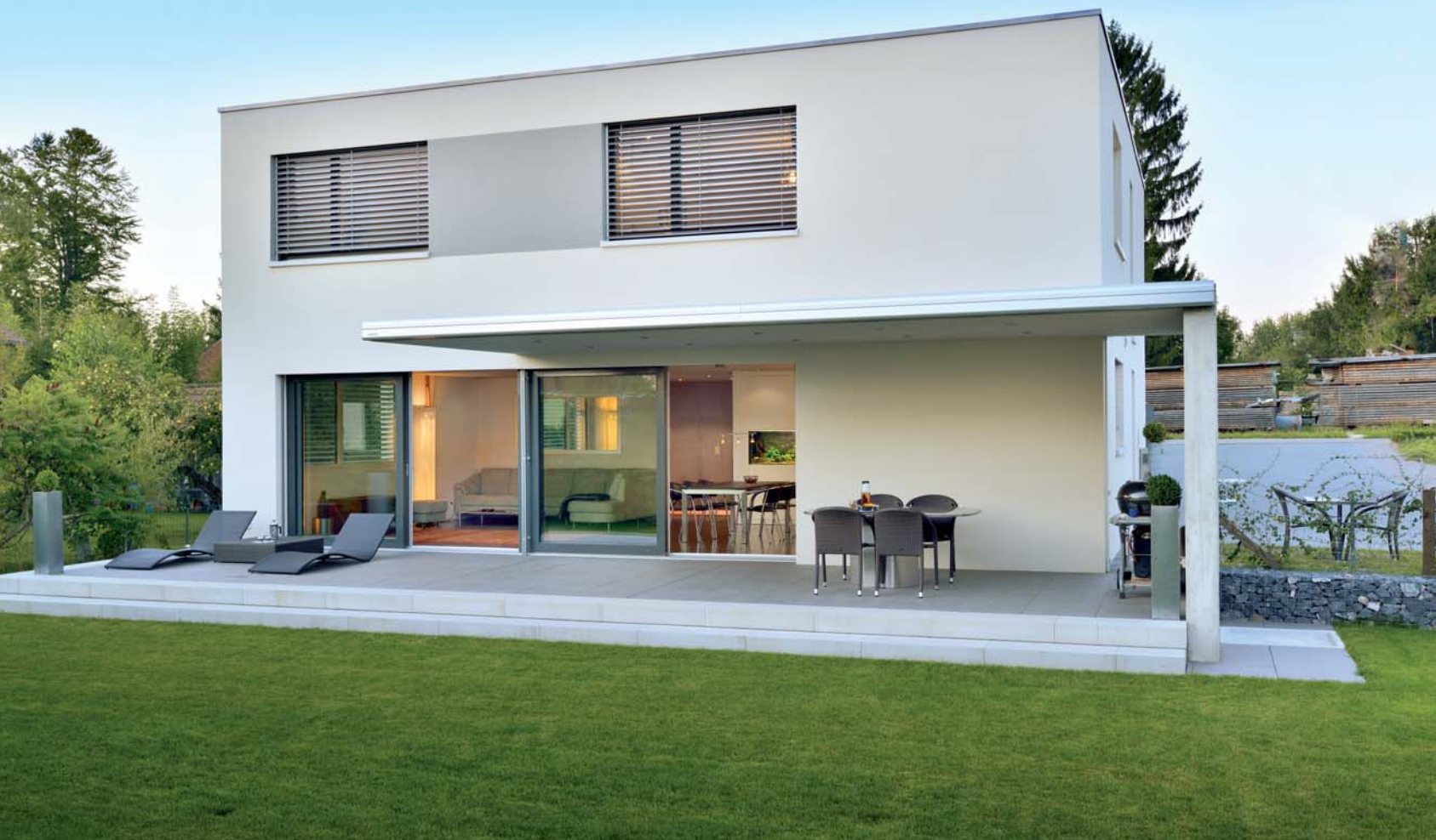
Foto gross oben) Die perfekte Bühne für ein gemütliches Barbecue – der Sommer kann kommen. Foto gross unten) Die angebaute Garage verlängert den kompakten Baukörper in der Horizontalen. 1) Im hellen Eingangsbereich werden Gäste empfangen. 2) Eingelassene Deckenlampen auch über dem gedeckten Gartensitzplatz.

Auszug aus der Zeitschrift DAS EINFAMILIEN HAUS erschienen am 25. Juli 2013 ©Etzel Verlag AG