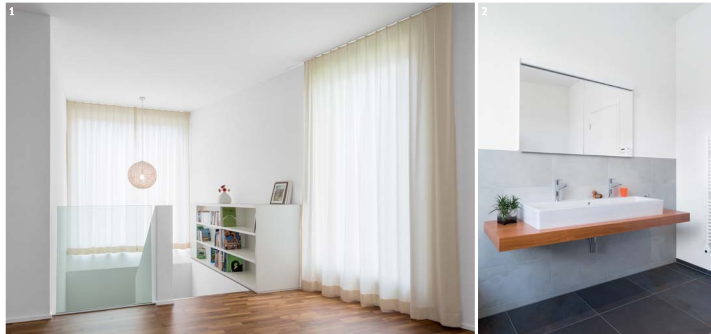
Foto gross oben) Das Zentrum des Familienlebens: Küche und Essbereich. Foto gross unten) Hell, geräumig und stilvoll präsentiert sich der Wohnbereich. 1) Riesige Fenster erhellen die Lounge im Obergeschoss. 2) Stilvolle Gestaltung im Badezimmer.