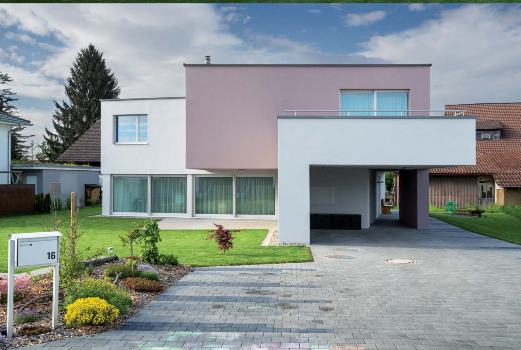
Foto gross oben) Ein kühner architektonischer Wurf mit exklusiver Wirkung. Foto gross unten) Hier sieht man schön die verschachtelte Baukomposition. 1) Das grosse Fenster bringt Licht ins Treppenhaus.

Auszug aus der Zeitschrift DAS EINFAMILIEN HAUS erschienen am 26. September 2013 ©Etzel Verlag AG